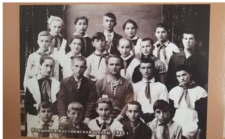
Учащиеся Костаевской школы, 1965 г.