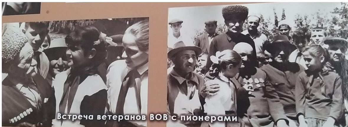
Встреча ветеранов ВОВ с пионерами