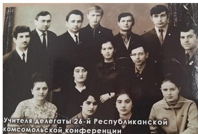
Учителя делегаты 26-й Республиканской комсомольской конференции